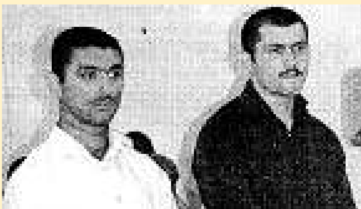
Os dois turcos condenados

As crianças foram recrutadas em várias províncias de Moçambique, com a permissão dos seus pais, sob a promessa de continuarem com os seus estudos, em Maputo.