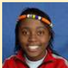
Gabatshwane África do Sul

Desde 2004 a SANTAC tem vindo a implementar o projecto Prémio Mundial da Criança pelos Direitos das Crianças (WCPRC). Este é o maior programa anual de educação e de aprendizagem dos direitos da criança, democracia e amizade mundial. Actualmente, abrange mais de 37.000 escolas num total de 17 milhões de estudantes de 92 países.