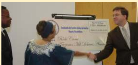
O Encarregado de Negócios dos EUA fazendo a entrega do cheque à Vice Presidente da Rede CAME

O primeiro acordo entre a Rede CAME e a Embaixada dos Estados Unidos teve lugar em 2005 e foi determinante para a coordenação das actividades da sociedade civil no seu processo de advocacia para uma legislação específica sobre o tráfico humano em Moçambique.