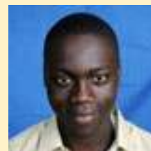
Bwami R.D. Congo