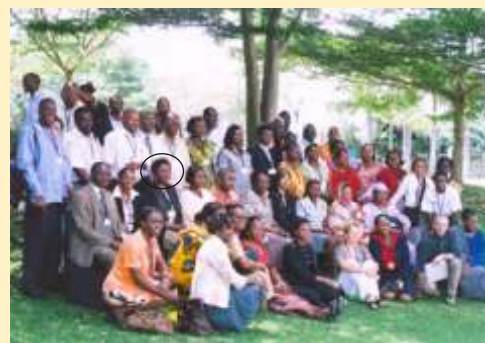
SANTAC Executive Director (in the circle) among CHI family

Com o novo cenário de casos violentos de tráfico internacional de crianças, as organizações Child Helpline estudam a possibilidade do estabelecimento de uma linha telefónica regional gratuita antes do Mundial de Futebol 2010 na África do Sul. O mais novo membro da Child Helpline na região da SADC é Moçambique que deu início através do estabelecimento de uma linha gratuita há dois anos com o envolvimento da Rede da Criança (uma rede de protecção da criança), da Rede CAME e da Save the Children Noruega.